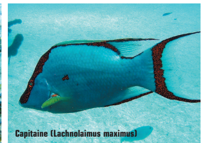
Capitaine ( Lachnolaimus maximus )