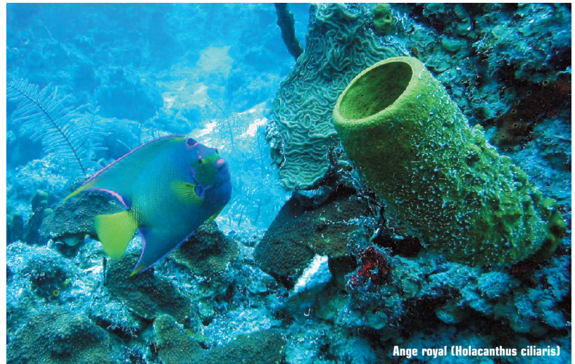
Ange royal ( Holacanthus ciliaris )

Les Guadeloupéens se sont adaptés aux types d'écosystèmes de chaque île et, selon leur provenance européenne ou africaine, différentes cultures ont émergé. Sur la première île que nous avons abordée, Marie-Galante, l'agriculture domine. Les gens ont la peau noire en raison de leur origine africaine. Leurs ancêtres étaient soumis à l'esclavage pour la production de la canne à sucre. Nous avons loué une voiture pour la journée, le temps de faire le tour de l'île et de visiter quelques distilleries de rhum. Un autre site enchanteur, la Maison Murat, offre une superbe vue sur la mer. Les vieux bâtiments en restauration abritaient anciennement l'une des exploitations sucrières les plus prospères de l'île, où plus de 300 esclaves y travaillaient. Par une merveilleuse coïncidence, nous étions sur cette île durant le Festival Terre de blues. J'ai eu l'occasion de voir, sous la pleine lune et les étoiles, un spectacle de l'illustre Johnny Clegg. D'origine anglaise et résidant en Afrique du Sud, il est un fervent défenseur des droits humains et un partisan antiapartheid.