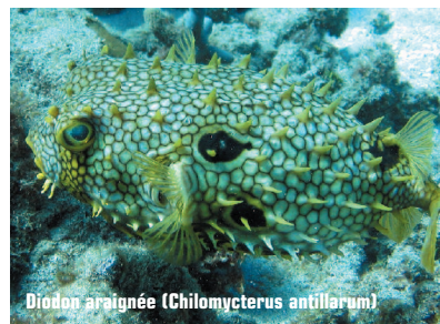
Diodon araignée ( Chilomycterus antillarum )