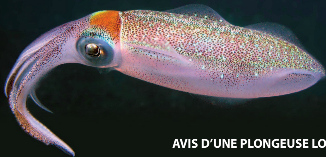
Calamar de la baie des Saintes : un mètre sous la surface